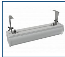
Кронштейн поворотный Piton (комплект)