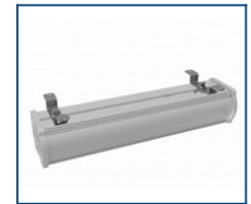
Скобы для накладного монтажа на стену Piton (комплект)