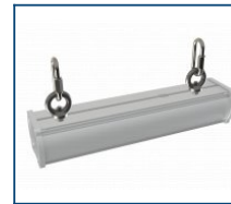
Кронштейн Diora Piton рым-болт (комплект)